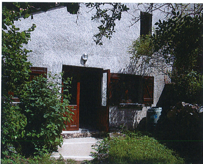
Entrée salle polyvalente