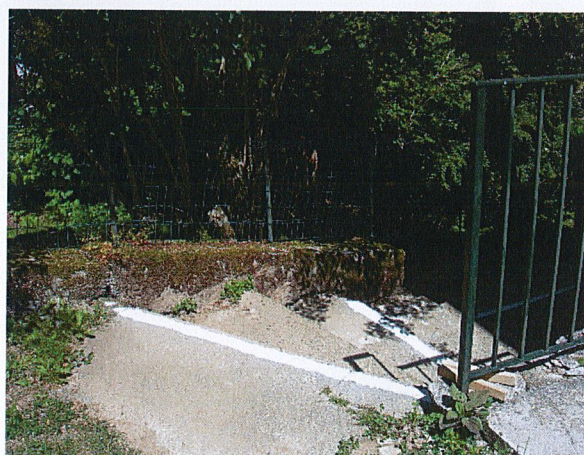
Accès salle polyvalente